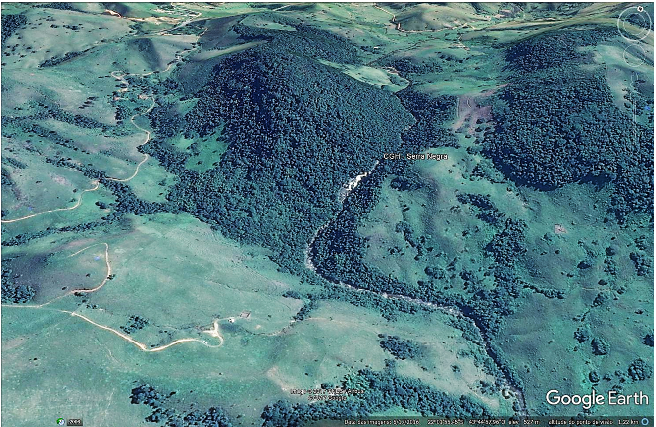
Vista do Local previsto para o empreendimento – Cachoeira da Bolsa