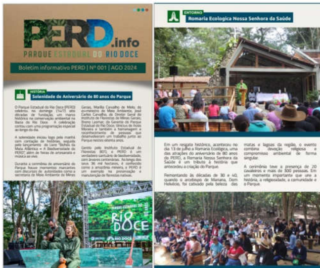
Figura 2: Boletim do PERD (1ª página), destacando o aniversário de 80 anos do PERD e a Romaria Ecológica realizadas em julho de 2024.

Estas e outras ações do PERD foram divulgadas no boletim informativo, cuja primeira página está apresentada na figura abaixo: