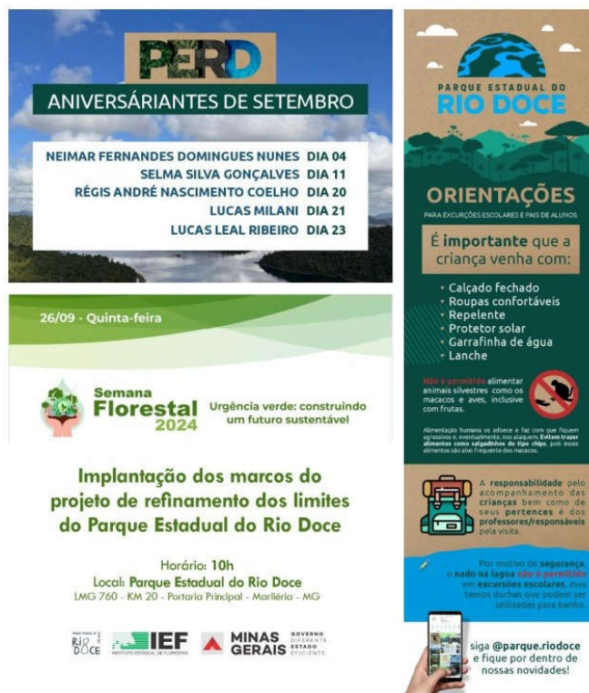
Figura 3: exemplo de peças de comunicação desenvolvidas no âmbito do TP que contribuem para a imagem positiva do parque.

Considerando-se o exposto, entende-se que o indicador teve sua meta plenamente atendida, dentro do prazo.