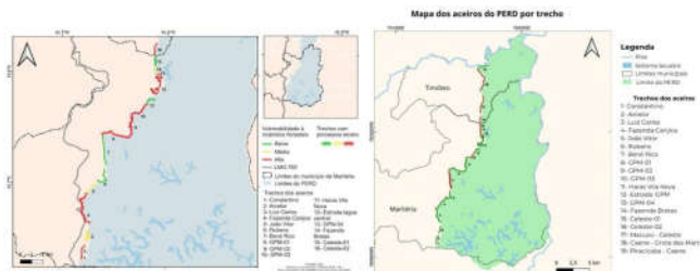
Figura 1: Mapa dos aceiros do PERD avaliados por trecho.

Conforme demonstrado pelo Relatório de Resultados do 11º Período Avaliatório (SEI 99238860), a manutenção dos aceiros na porção do Parque inserida no município de Marliéria foi viabilizada mediante parceria entre o Instituto Ekos e a municipalidade. Por meio desta parceria foi realizada a manutenção de 29,14km, superior ao previamente planejado para aquele trecho. Na região da UC pertencente ao município de Timóteo a manutenção de aceiros foi realizada por meio do Termo de Cooperação entre IEF e o município de Timóteo nos trechos Piracicaba-Caene (1,88km), Caene-Grota dos Martins (4,5km) e Macuco-Celeste (2,97 km).