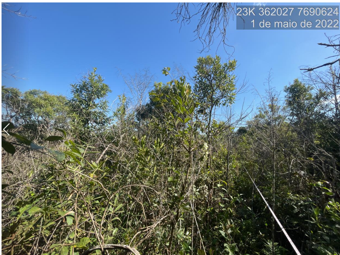
Figure 8: Vista da área de Cerrado sensu stricto alvo do processo de solicitação de intervenção ambiental. Observa-se indivíduos arbóreos de pequeno porte.

Portanto, conforme dados técnicos levantados pelo inventário florestal qualitativo e quantitativo afirma-se que o fragmento em análise pertence a fitofisionomia Cerrado sensu stricto , portanto não passível de enquadramento conforme estágios sucessionais definidos pela Lei nº 11.428 de 22 de Dezembro de 2006 (Lei da Mata Atlântica).