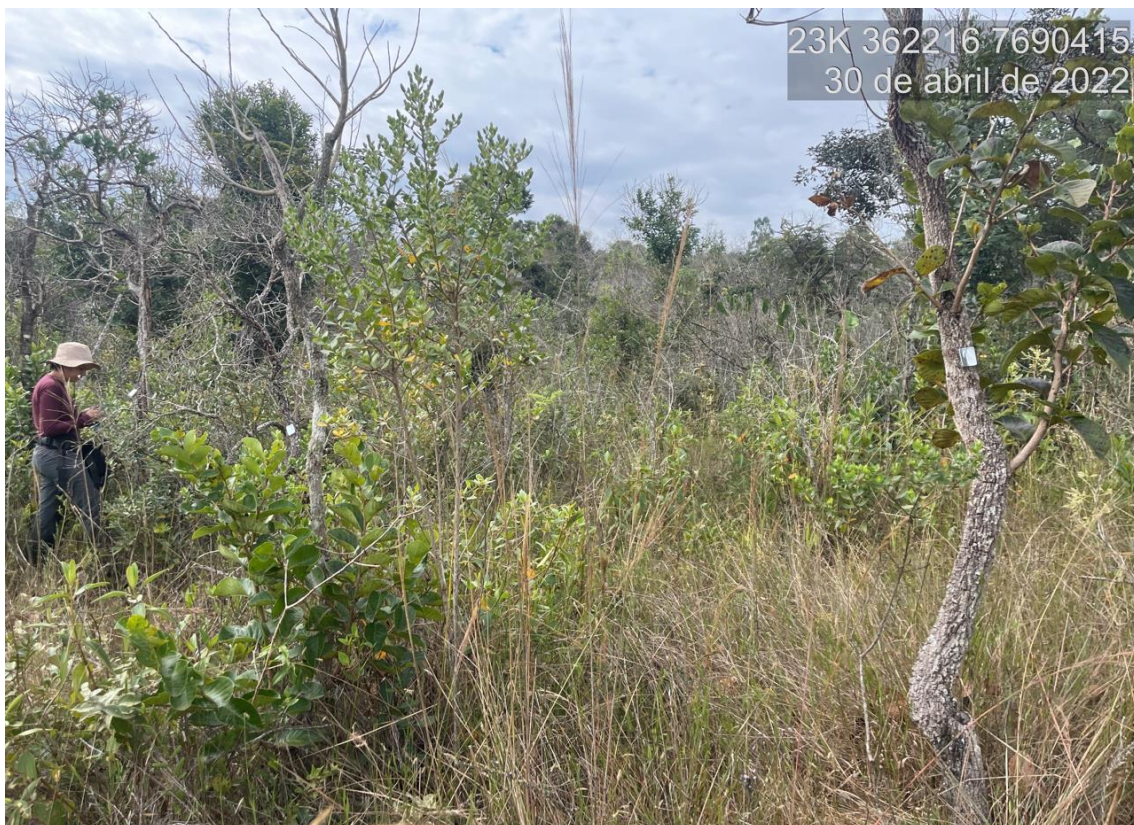
Figure 4: Vista da área de Cerrado sensu stricto alvo do processo de solicitação de intervenção ambiental. Observa-se indivíduos mensurados e plaqueteados.