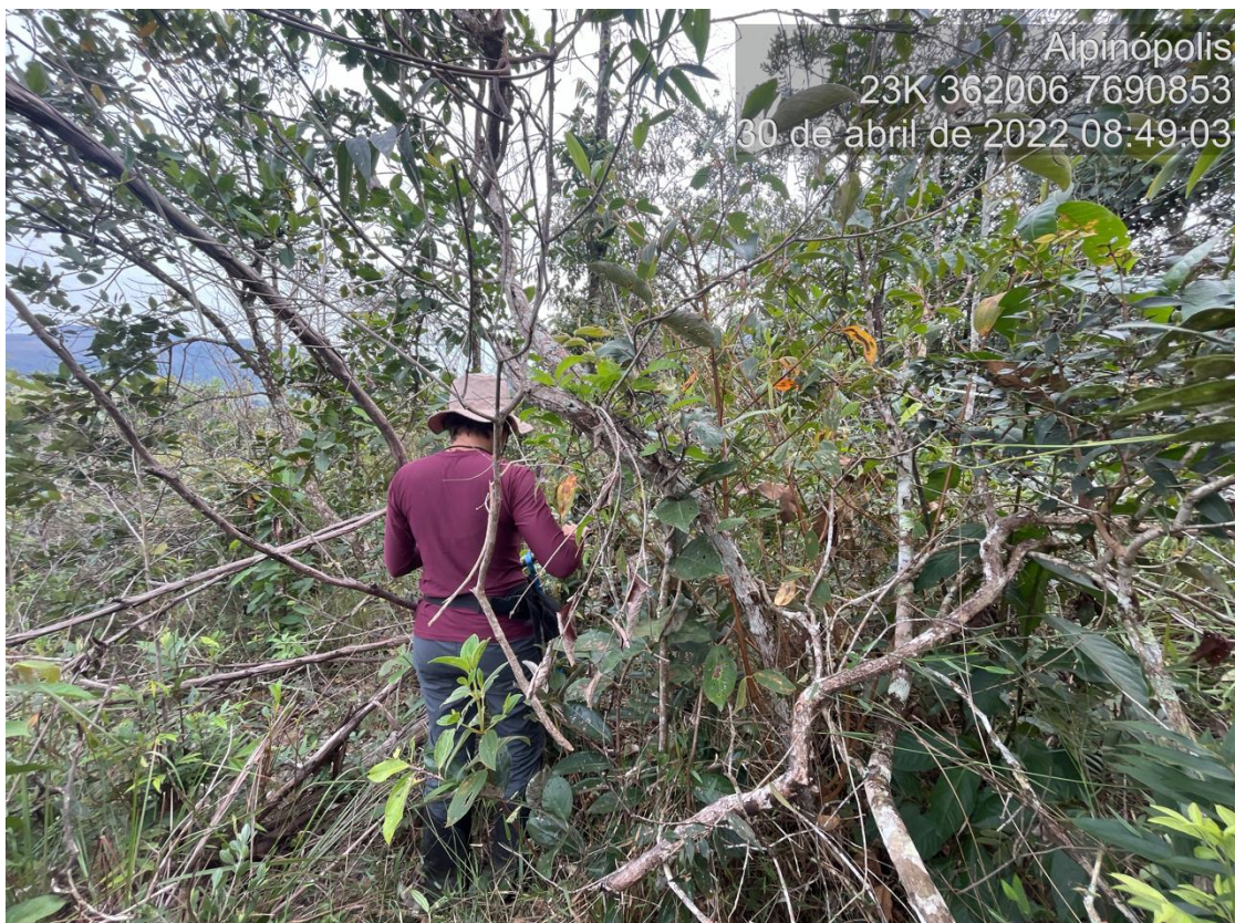
Figure 1: Vista da área de Cerrado sensu stricto alvo do processo de solicitação de intervenção ambiental.