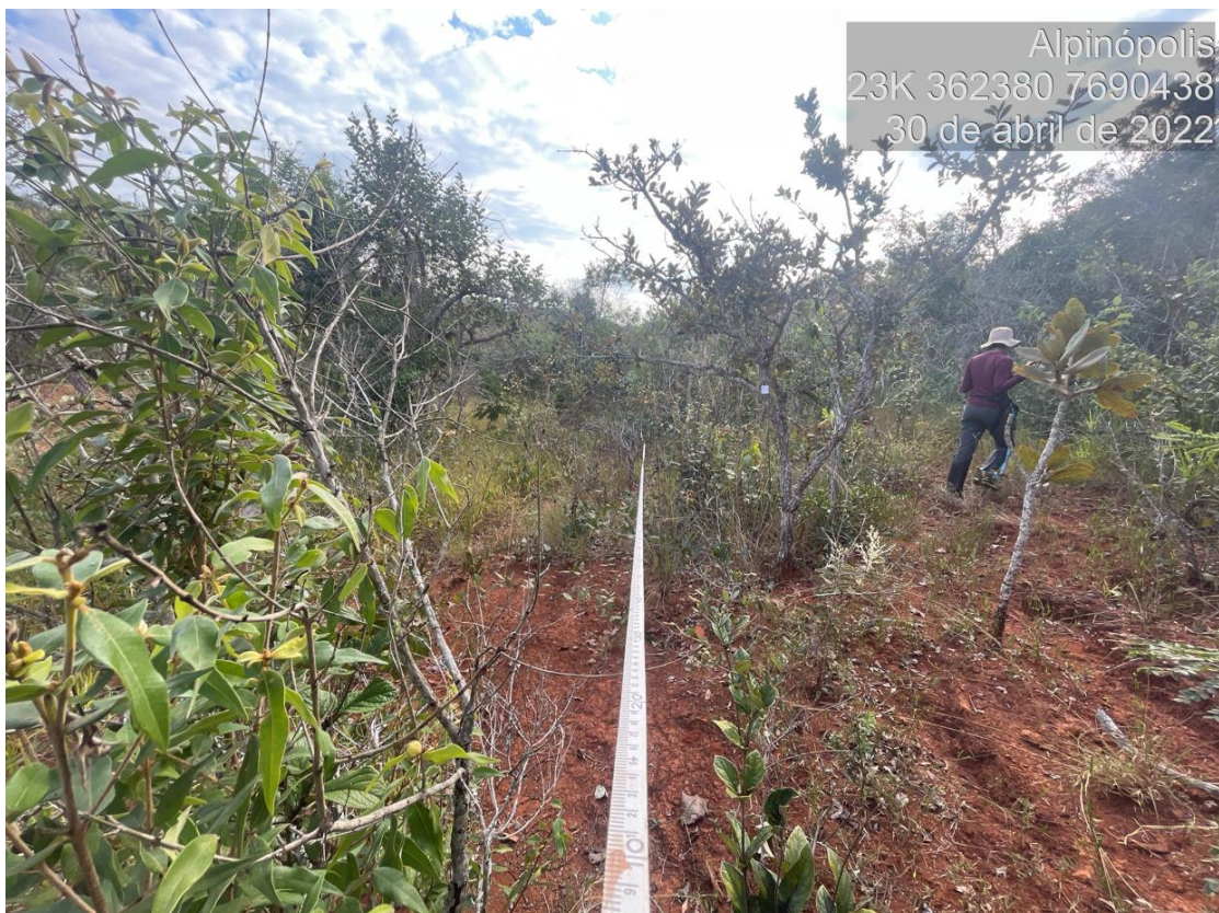
Figure 6: Vista da área de Cerrado sensu stricto alvo do processo de solicitação de intervenção ambiental.