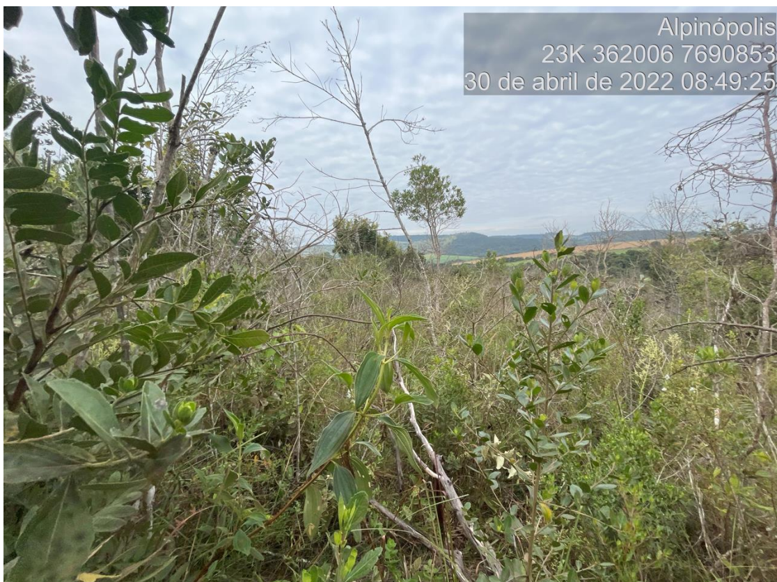
Figure 2: Vista da área de Cerrado sensu stricto alvo do processo de solicitação de intervenção ambiental. Nota-se que não há formação de dossel contínuo.