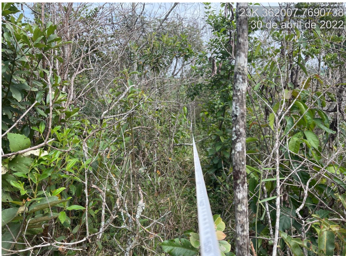
Figure 3: Vista da área de Cerrado sensu stricto alvo do processo de solicitação de intervenção ambiental. Nota-se predominância de indivíduos de pequeno porte.