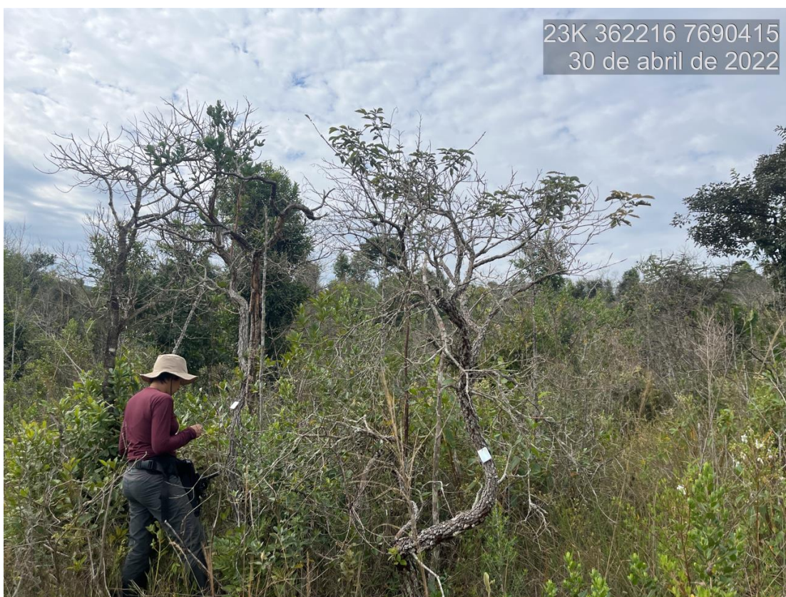
Figure 5: Vista da área de Cerrado sensu stricto alvo do processo de solicitação de intervenção ambiental. Observa-se indivíduos mensurados e plaqueteados.