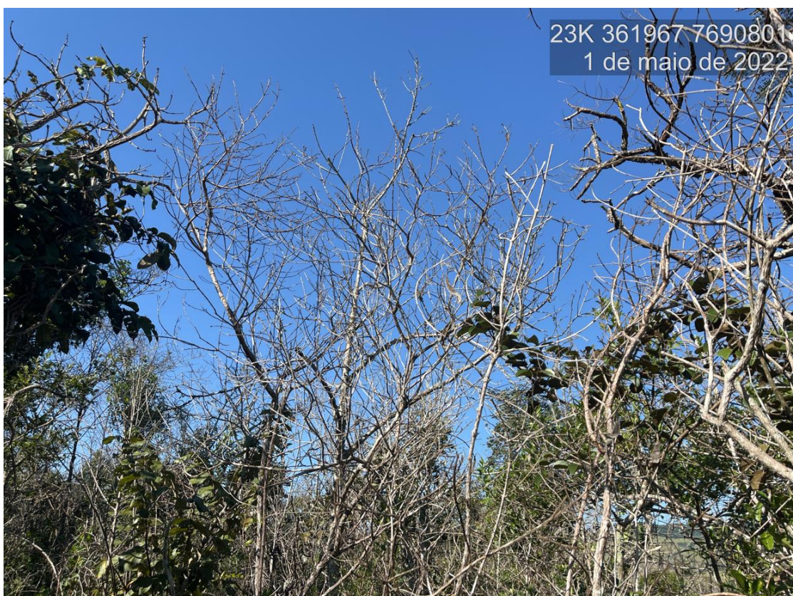
Figure 7: Vista da área de Cerrado sensu stricto alvo do processo de solicitação de intervenção ambiental. Observa-se presença de árvores mortas.