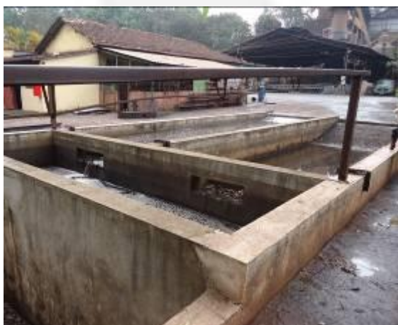
Foto 09. Tanque de decantação de sólidos.