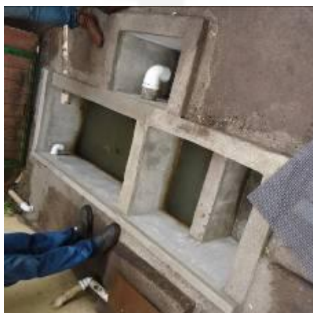
Foto 14. Caixa SAO