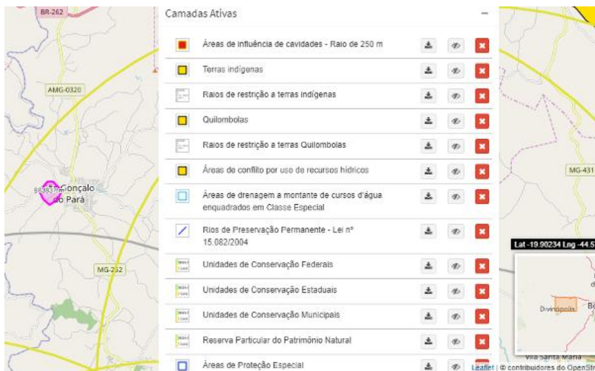
Fig. 4 – Análise de critérios locacionais/ restrições ambientais conforme IDE Sisema.

de restrições ambientais disponíveis no IDE Sisema. Conforme consulta realizada, não há quaisquer restrições ambientais para a atividade na área da empresa.