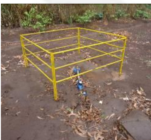
Foto 15. Poço tubular para captação subterrânea