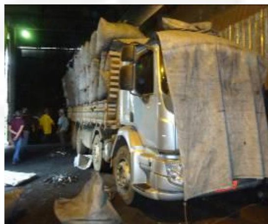
Foto 04. Galpão enclausurado para descarga de carvão vegetal.