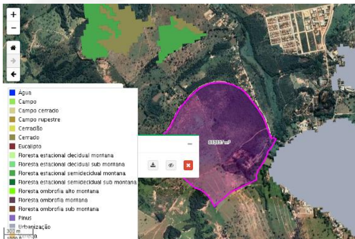
Figura 06: Mapeamento florestal da área de entorno (IDE SISEMA).

Em consulta ao IDE Sisema verifica-se que os remanescentes de vegetação nativa no entorno do imóvel são caracterizados como cerrado e floresta estacional semidecidual.