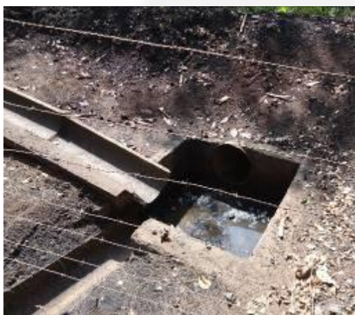
Foto 07. Canaletas para drenagem pluvial.