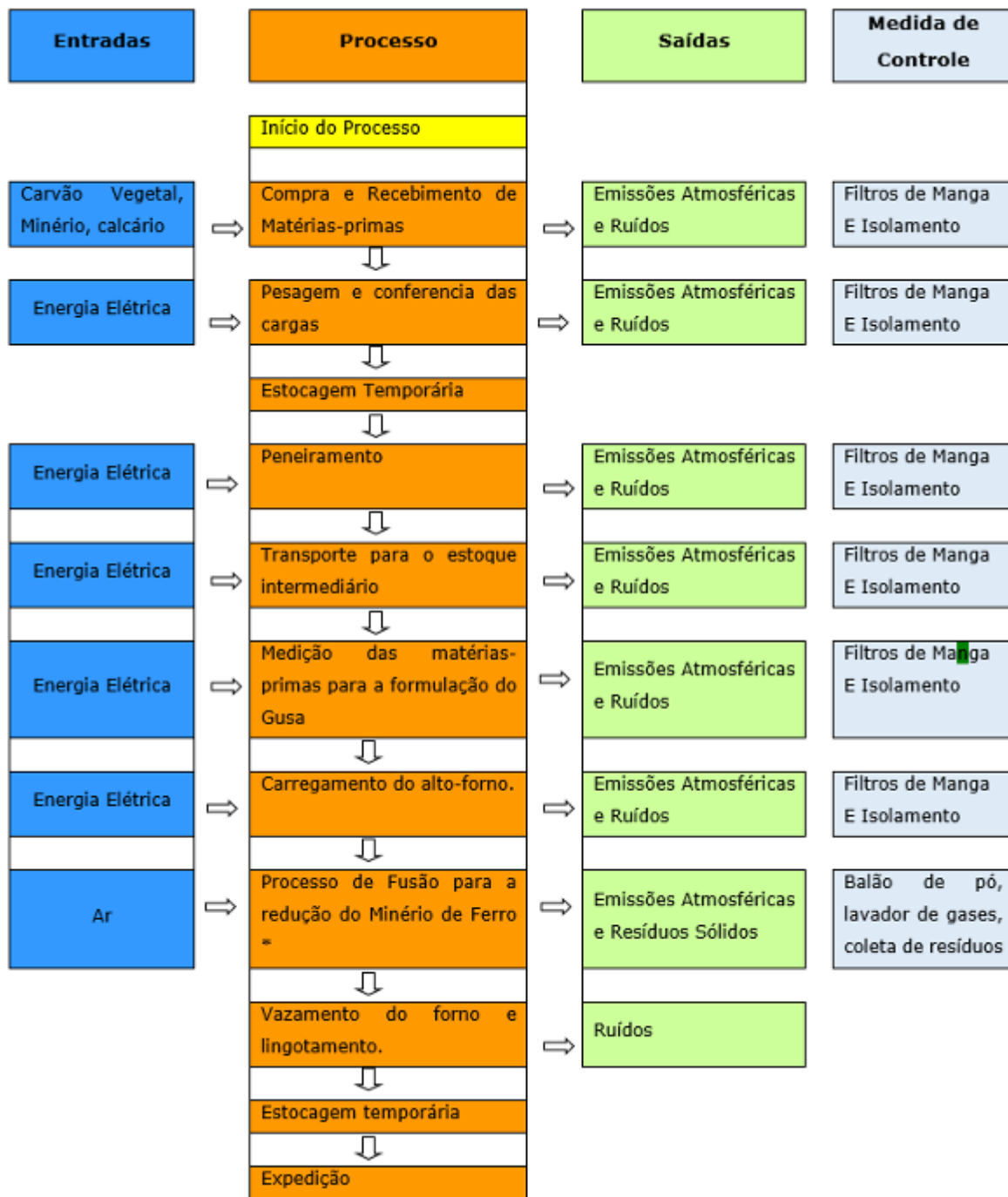
Fig. 3 – Fluxograma com ilustração do processo produtivo.