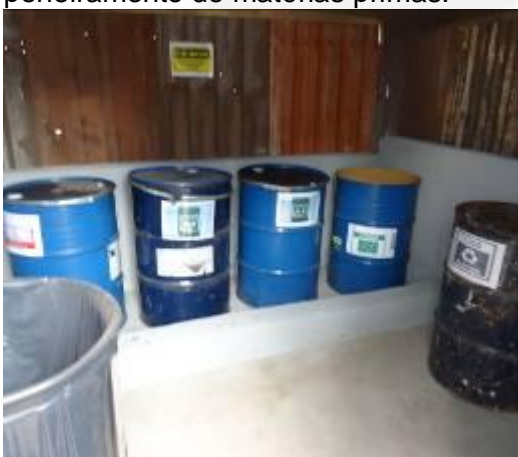
Foto 13. Área de armazenamento de resíduos contaminados.