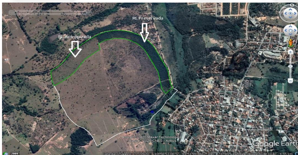
Figura 08: Áreas de Reserva Legal (polígono verde), onde constata a diferenciação entre a porção antropizada (sem vegetação nativa, apenas algumas árvores isoladas) e a preservada (vegetação densa).

Diante da constatação de que parte da Reserva Legal se encontra antropizada por pastagem exótica. Foi solicitado por meio de ofício de informações complementares nº 319/2020 a proposição de Projeto Técnico de Reconstituição da Flora – PTRF visando a recuperação dessa área.