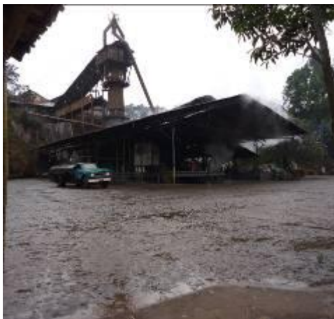
Foto 01. Área do alto forno e via interna