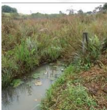
Foto 16. Córrego dos Pintos.