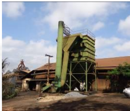
Foto 02. Filtro de mangas para efluentes gerados no peneiramento e manuseio de matérias primas