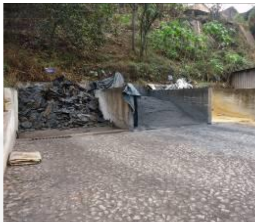
Foto 06. Baias para armazenamento de resíduos.